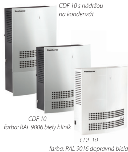
CDF 10 s nádržou na kondenzát

Okrem zabudovaného hygrostatu nastaveného na 60% relatívnej vlhkosti a LED signalizácie zobrazujúcej všetky prevádzkové stavy, ponúkajú tieto odvlhčovače pripojenie na bezdrôtový diaľkový ovládač DRC1, ktorý umožňuje diaľkovo nastaviť teplotu, vlhkosť, či zobrazí poruchy alebo servisné informácie.