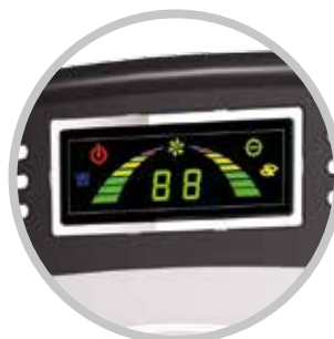
DISPLAY A LED LED DISPLAY