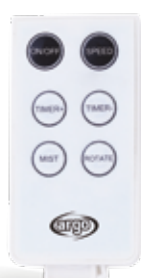
TELECOMANDO MULTIFUNZIONE SLIM SLIM MULTIFUNCTION REMOTE CONTROL