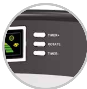
PANNELLO COMANDI MANUALE MANUAL CONTROL PANEL