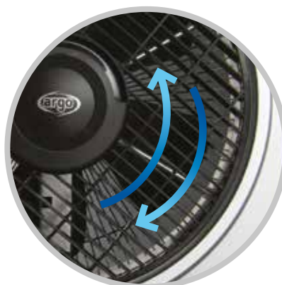
ROTAZIONE GRIGLIA A 360° PER OTTIMIZZAZIONE FLUSSO D'ARIA GRID 360° ROTATION, FOR AIRFLOW OPTIMIZATION