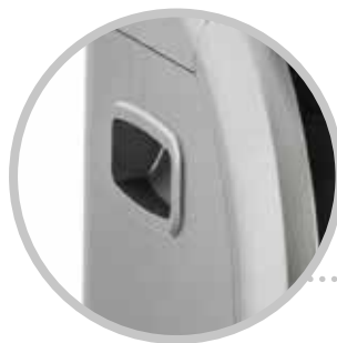
PRATICHE MANIGLIE LATERALI USEFUL SIDE HANDLES