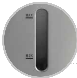
OBLÒ CONTROLLO LIVELLO ACQUA WATER LEVEL WINDOW