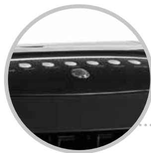
PANNELLO COMANDI CONTROL PANEL